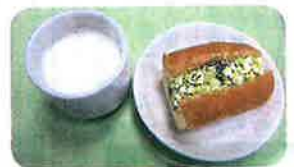
ブロッコリーとゆで卵を菜の花に見立てたロールサンドです。